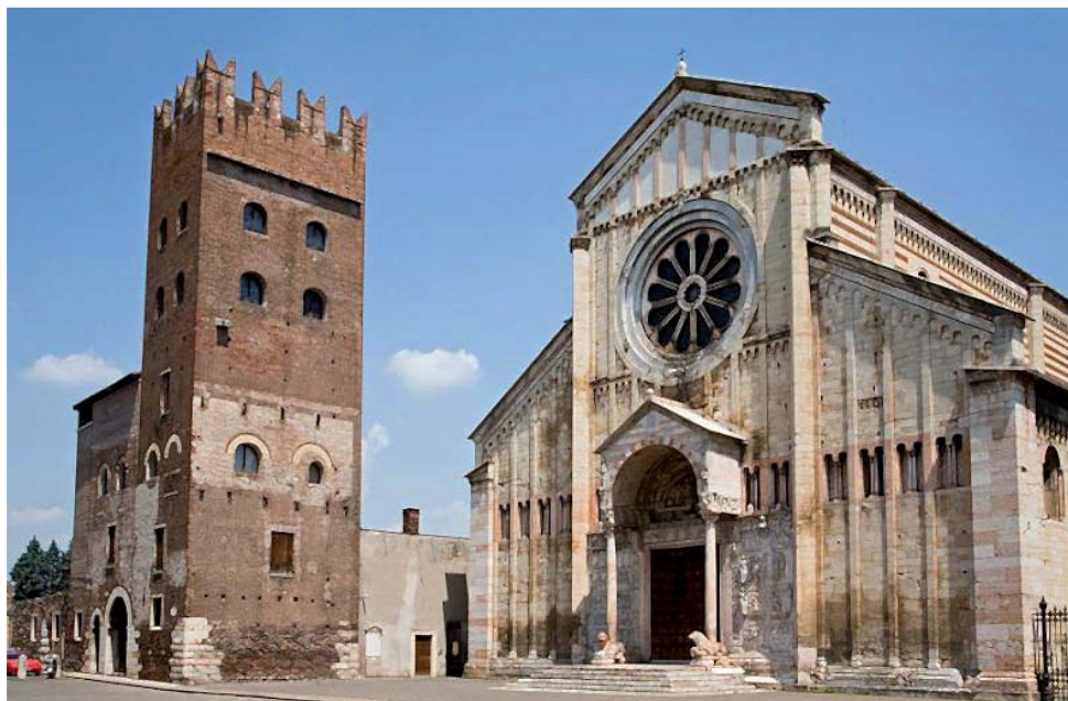
Verona, Abbazia di San Zeno